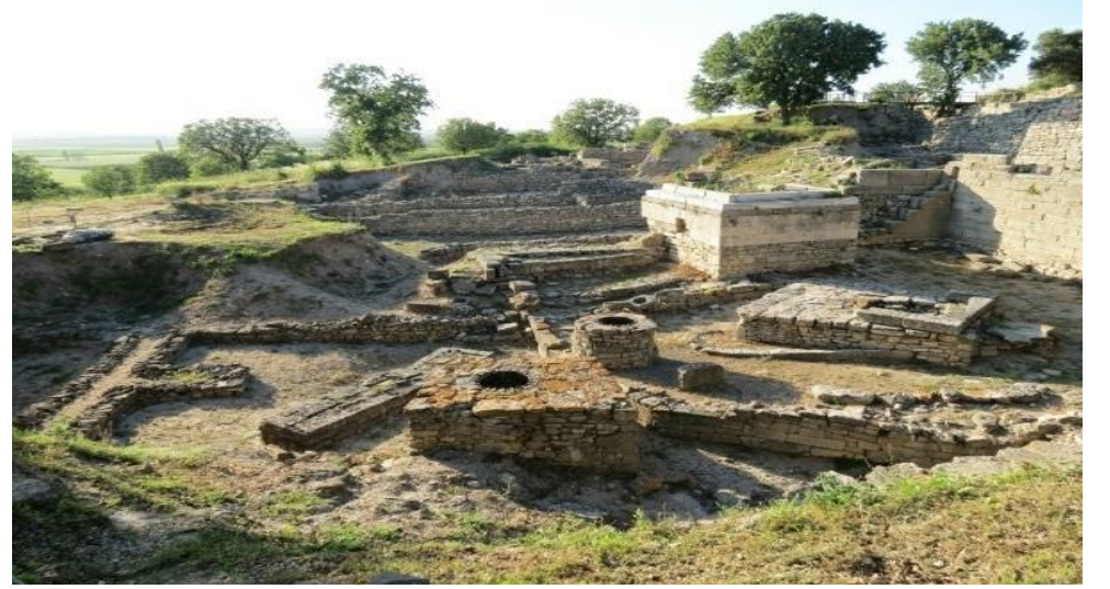
Troya Ören Yeri

Troya, dünyanın en ünlü antik kentlerinden birisidir. Troya’da görülen 10 katman, kesintisiz olarak 3000 yıldan fazla bir zamanı göstermekle birlikte Anadolu, Ege ve Balkanların bulunduğu bu benzersiz coğrafyada yerleşmiş olan uygarlıkları izlememizi sağlamaktadır. Troya’daki en erken yerleşim katı M.Ö. 3000-2500 ile Erken Tunç Çağı’na tarihlenmektedir. Daha sonra sürekli yerleşim gören kent, M.Ö. 85 – M.S. 500 yılları arasında IX. Troya olarak adlandırılır ki bu tabaka Roma Dönemi Troya’sıdır. Troya X’de ise şehir, 12.yüzyıl’dan 13. yüzyıla kadarki zaman dilimi içerisinde Bizans yerleşimi olarak iskan görmüştür. Bu tarihten sonra da, o dönemdeki büyük politik değişimler nedeniyle eski önemini kaybetmiştir.